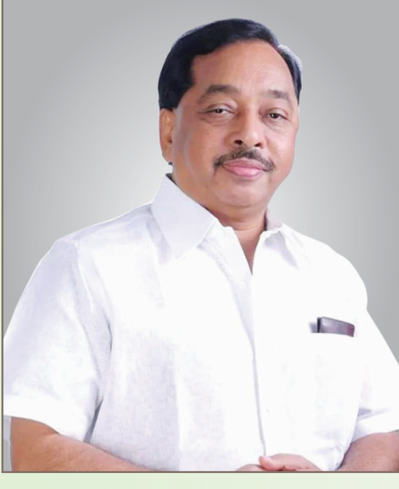
नारायण राणे NARAYAN RANE